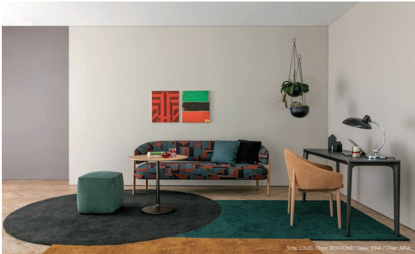
Sofa: LOUIS / Stool: BOCCONE / Desk: IENA / Chair: NINA