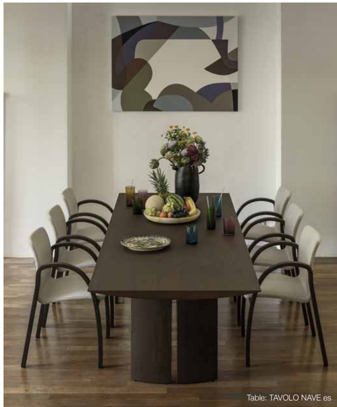
Table: TAVOLO NAVE es