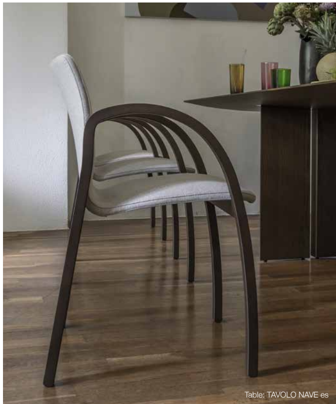
Table: TAVOLO NAVE es

1986年発売のチェア〈FK〉の復刻モデル。 背と座、アームと脚部が一体となり、少ないパーツで構成された明快なデザイン。 リズムカルなアーチは見た目にも軽やかで、チェアを持って移動しやすい利便性にもつながっています。 当時の製品よりシートのウレタンを増すことで座り心地を改良し、アームのエッジに丸みをつけて手当たりを良くするなど、随所に細かなブラッシュアップを加えました。