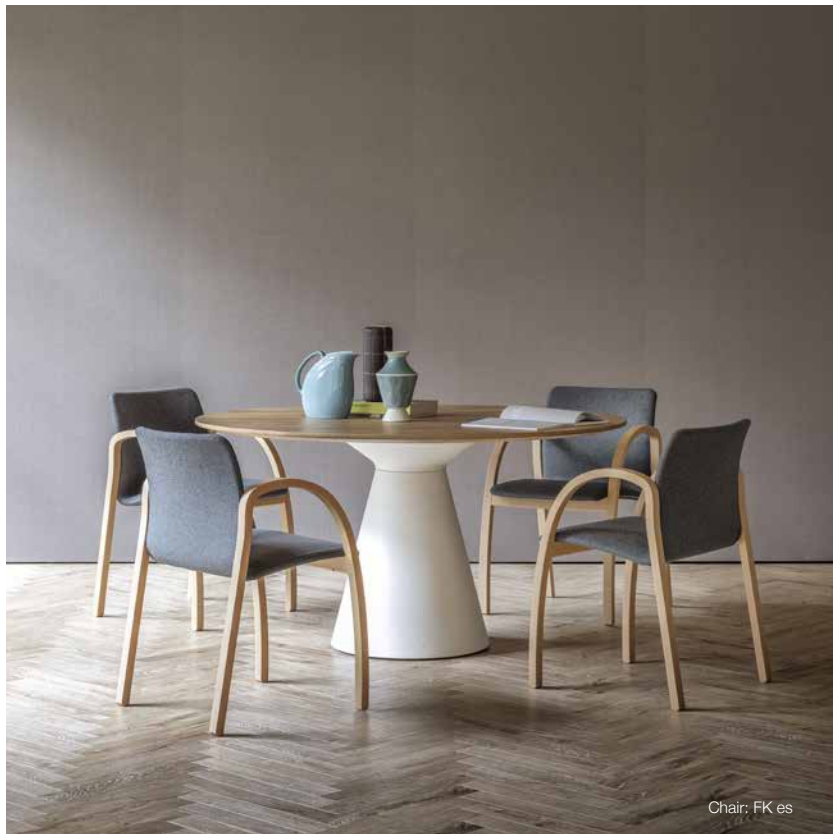
Chair: FK es